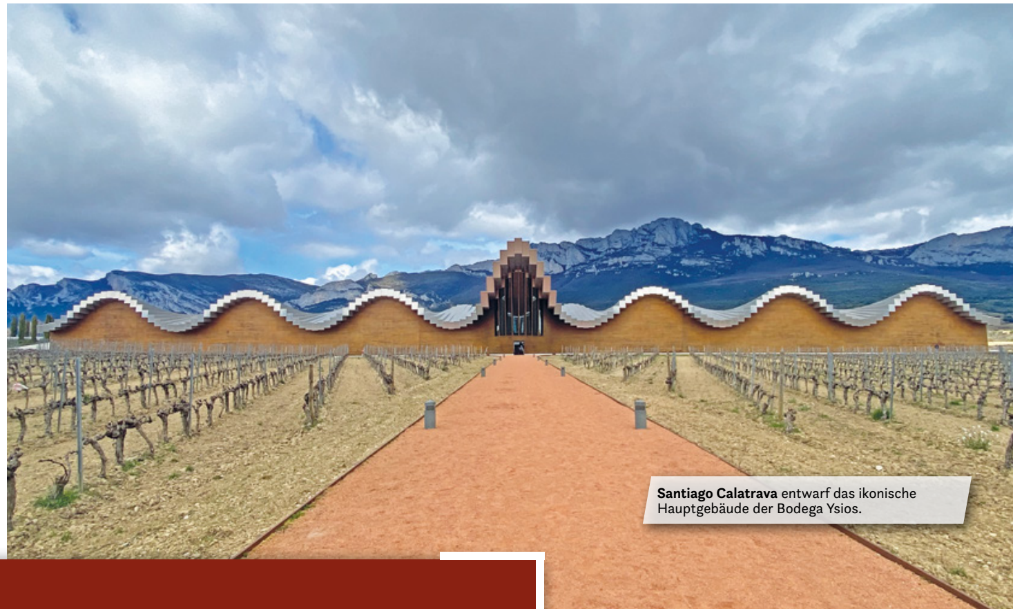
Santiago Calatrava entwarf das ikonische Hauptgebäude der Bodega Ysios.