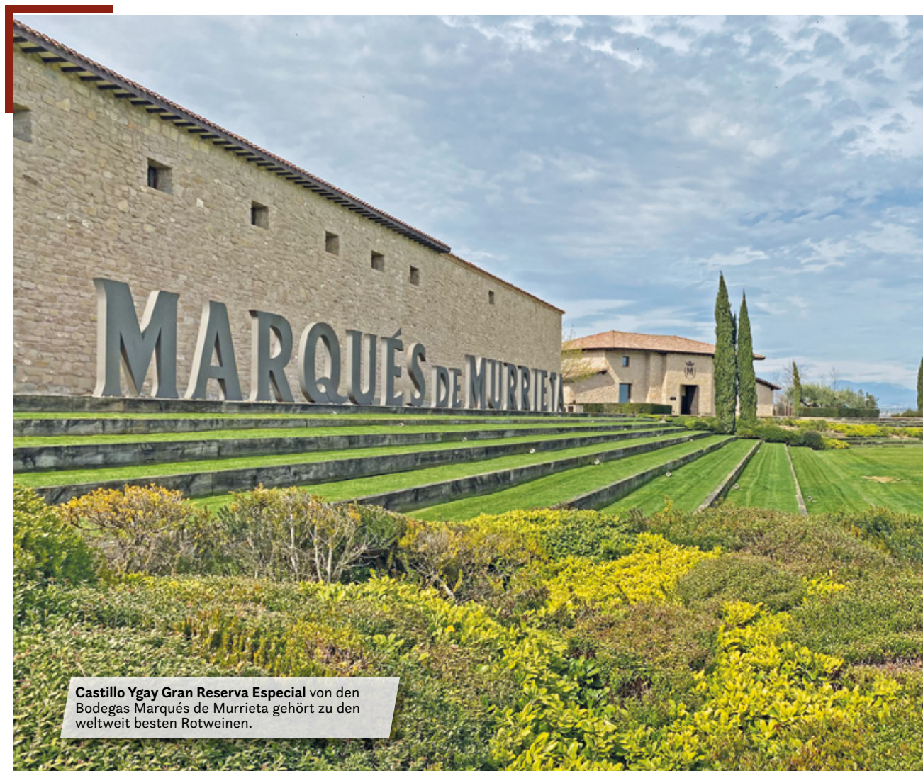
Castillo Ygay Gran Reserva Especial von den Bodegas Marqués de Murrieta gehört zu den weltweit besten Rotweinen.

Womit wir bei den Weinen sind, deren hervorragender Ruf in der ganzen Welt bekannt ist. Insbesondere der Rotwein „Castillo Ygay Gran Reserva Especial“ erzielt höchste Bewertungen und gehört zu den besten Weinen der Welt. Daher ist es auch nicht verwunderlich, dass die Preise für eine Flasche enorm gestiegen sind. Lag der Verkaufspreis vor ein paar Jahren noch um die 80 Euro, so wird sie heute um die 250 gehandelt – mit Luft nach oben. Also nicht lange überlegen. Nächstes Jahr wird sie sicher teurer.