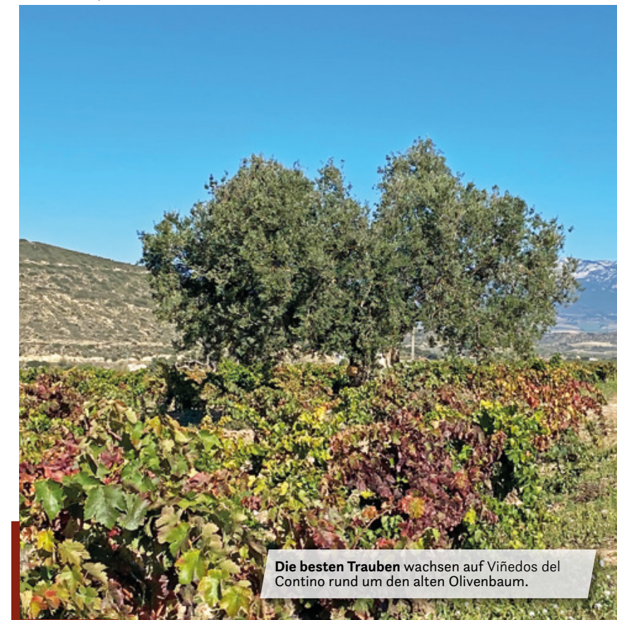
Die besten Trauben wachsen auf Viñedos del Contino rund um den alten Olivenbaum.

Aber vorher sollten wir uns überlegen, ob wir nicht einem „Geheimtipp“ folgen wollen, um