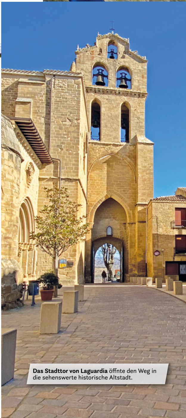
Das Stadttor von Laguardia öffnete den Weg in die sehenswerte historische Altstadt.

Nach diesem Abenteuer fahren wir weiter bis zum sehr pittoresken Dorf Laguardia. Hier finden wir eine stattliche Anzahl von bekannten Bodegas. Aber auch der Ort selbst lohnt einen Besuch. Nicht zuletzt, weil Laguardia auch die Hauptstadt der Rioja Alavesa genannt wird. Netterweise haben die Stadtväter vor kurzem einen schönen und großen Parkplatz am Fuße des Hügels angelegt, auf dem Laguardia liegt. Zu Fuß geht es zum Fahrstuhl und oben angekommen, sind wir auch gleich vor dem Haupttor von Laguardia. Eine Besichtigung der kleinen Altstadt hinter den historischen Stadtmauern lohnt sich auf jeden Fall. In den engen Gassen fühlt sich der Besucher gleich wie im Mittelalter – obwohl es auch zeitgemäße Läden und Vinotheken gibt, wie „Pepita