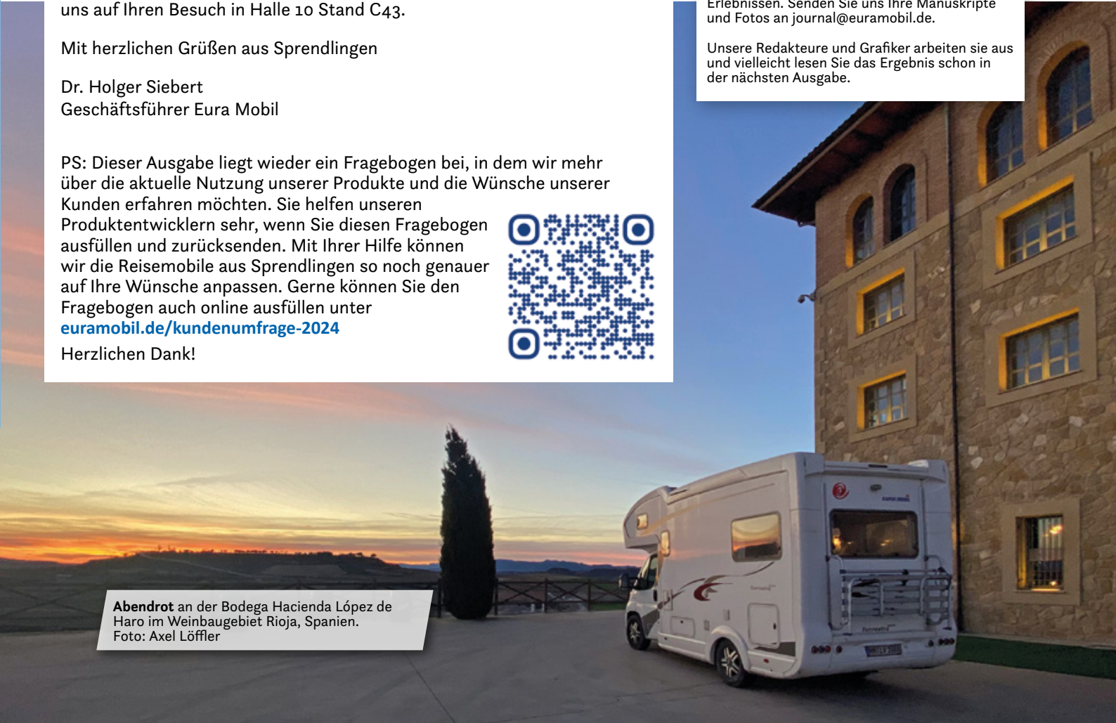
Abendrot an der Bodega Hacienda López de Haro im Weinbaugebiet Rioja, Spanien.

Ein Service-Center der Santander Consumer Bank