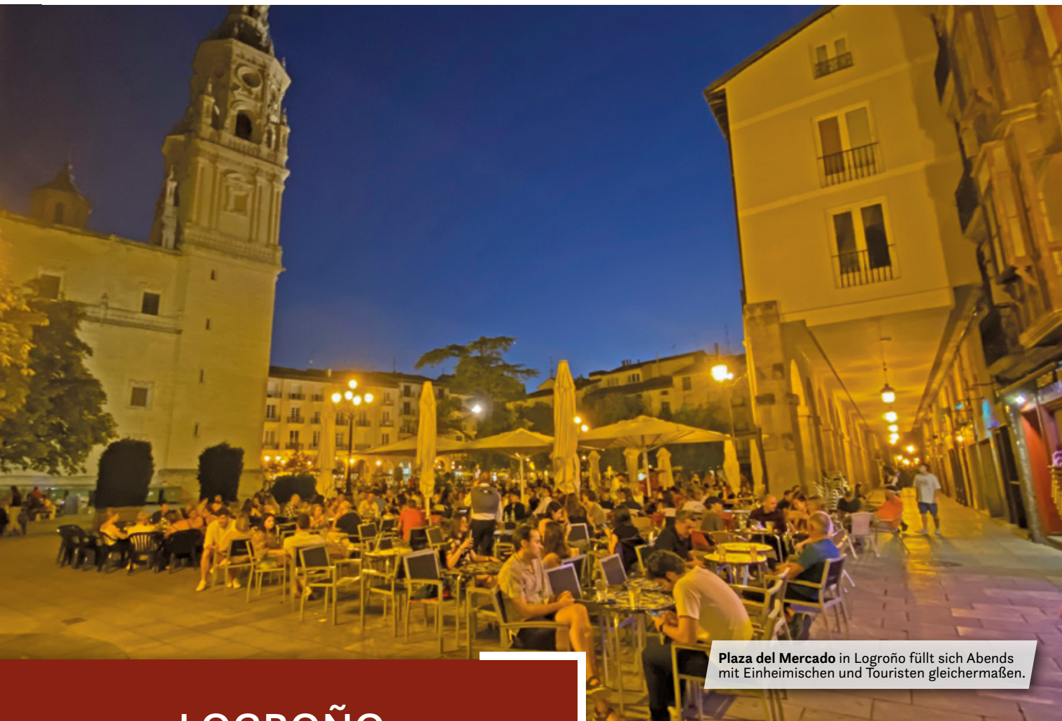
Plaza del Mercado in Logroño füllt sich Abends mit Einheimischen und Touristen gleichermaßen.