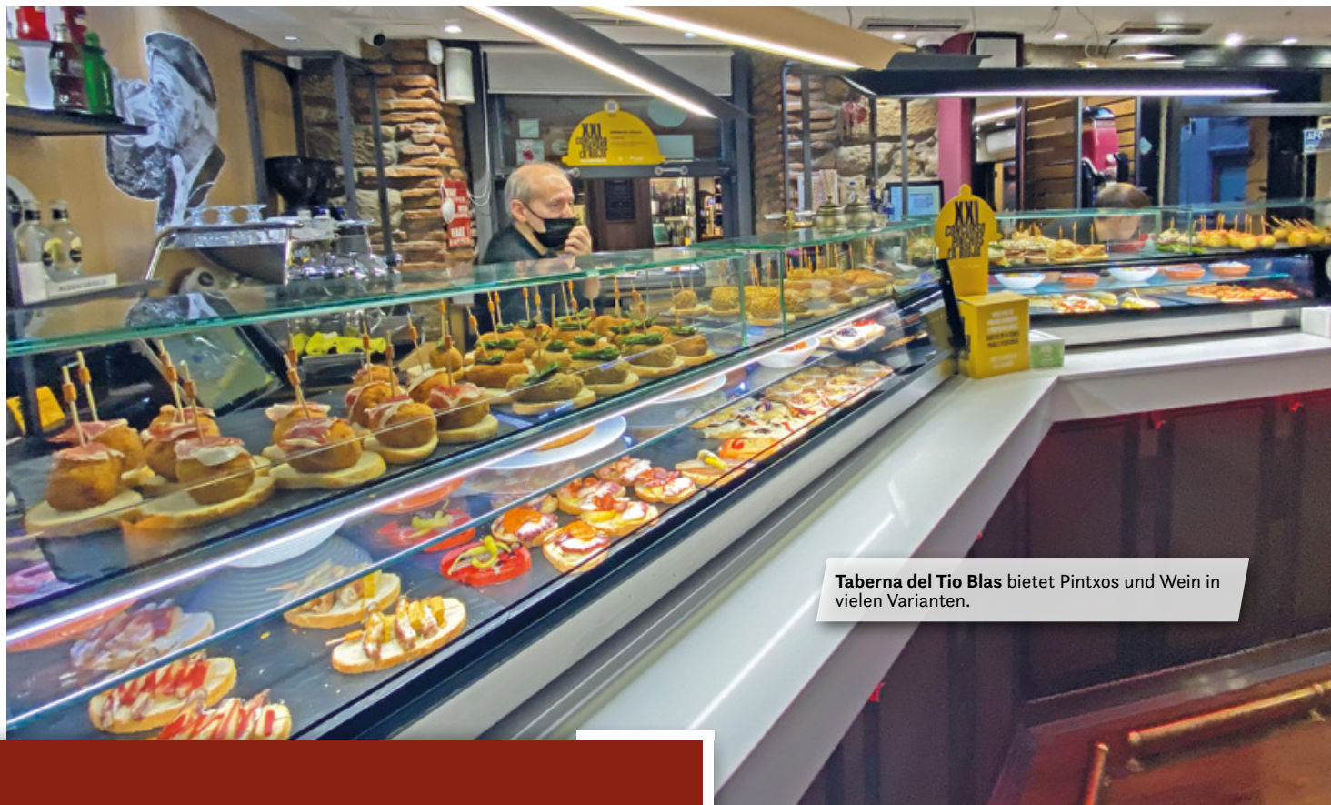
Taberna del Tío Blas bietet Pintxos und Wein in vielen Varianten.