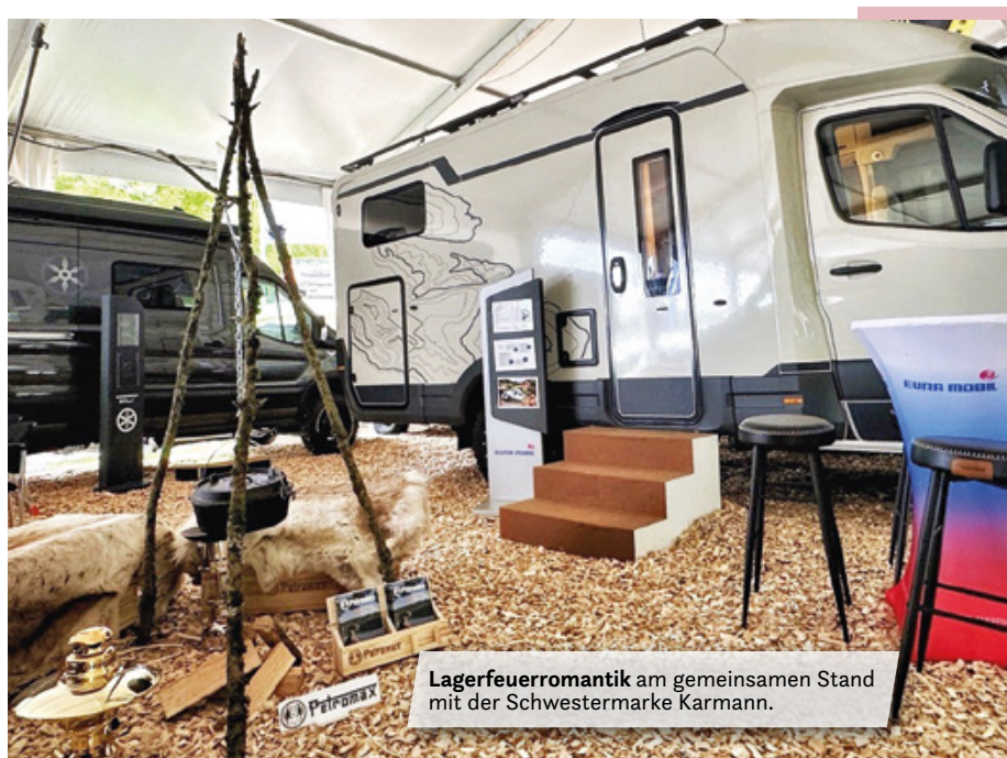
Lagerfeuerromantik am gemeinsamen Stand mit der Schwestermarke Karmann.

Etwas Fernweh wollen wir in Halle 10 Stand C 43 des Düsseldorfer Messegeländes entstehen lassen, indem wir rund um den Xtura eine Off-Road Atmosphäre an unserem Messestand inszenieren. Besuchen Sie uns zwischen dem 30. August und dem 8. September und lassen Sie sich überraschen.