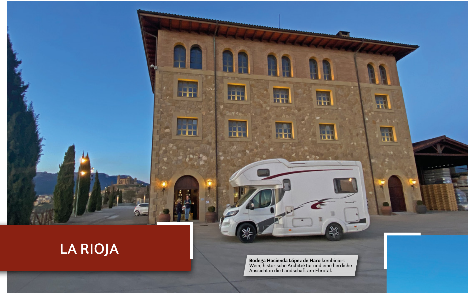
Bodega Hacienda López de Haro kombiniert Wein, historische Architektur und eine herrliche Aussicht in die Landschaft am Ebrothal.