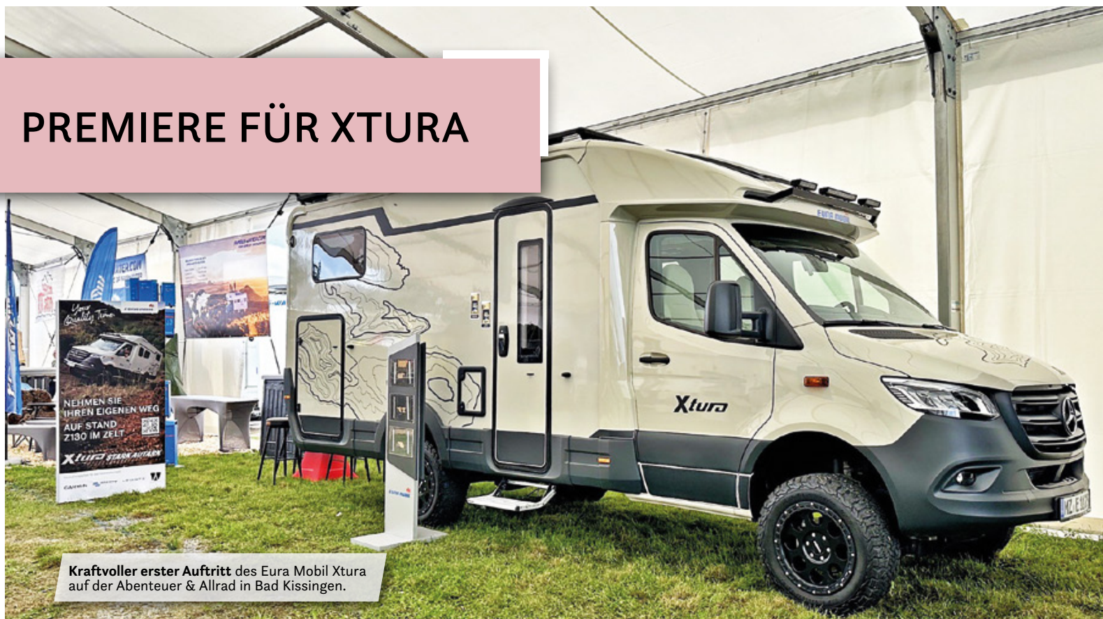
Kraftvoller erster Auftritt des Eura Mobil Xtura auf der Abenteuer & Allrad in Bad Kissingen.