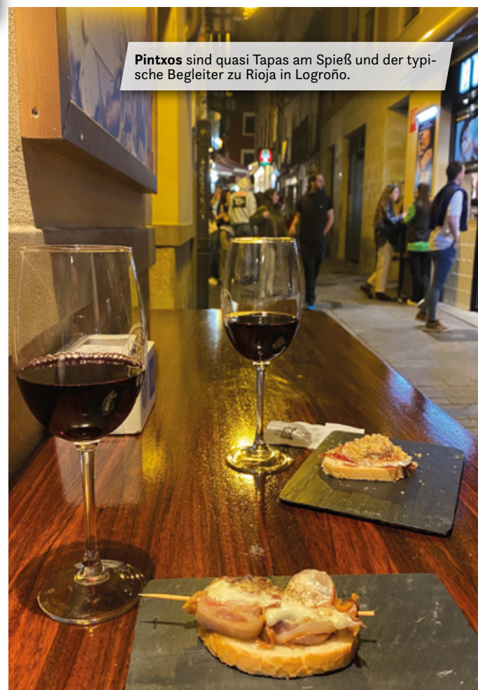
Pintxos sind quasi Tapas am Spieß und der typische Begleiter zu Rioja in Logroño.

Ein guter Start für die Pintxos-Tour ist die Calle Laurel Nr. 1. Dort befindet sich die „Taberna del Tio Blas“, die eine sehr schöne Auswahl dieser Spezialitäten hat. Die Taberna ist eine typische Pintxos-Bar, die gerne von Einheimischen aufgesucht wird, aber sie ist auch auf Touristen eingestellt. Das hat den Vorteil früher Öffnungszeiten. Denn eigentlich machen die Pintxos-Bars erst gegen 20:00 Uhr auf. Das „typische“ Pintxos-Leben beginnt so ab 20:30 Uhr. Dann wird es in der Calle del Laurel und der angrenzenden Travesia recht eng und lebhaft.