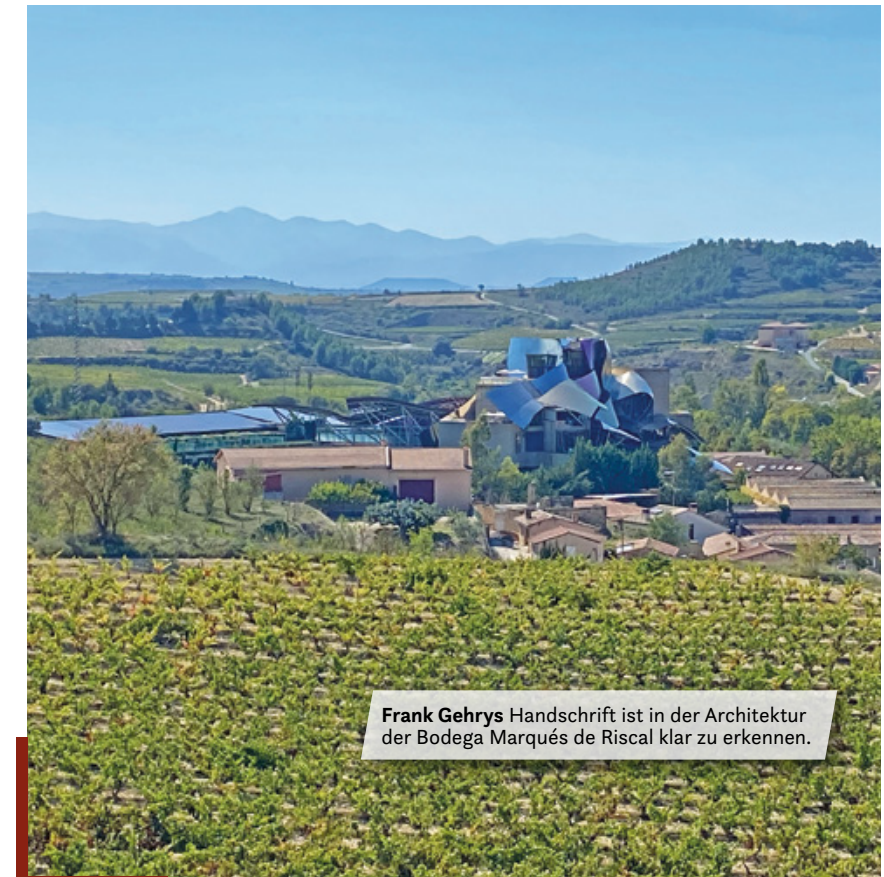
Frank Gehrys Handschrift ist in der Architektur der Bodega Marqués de Riscal klar zu erkennen.

Eine Ikone unter den Bodegas, nicht nur im Rioja, sondern in ganz Spanien. Mit dem ersten Jahrgang von 1862 ist sie eine der ältesten des Rioja. Aber man lebt die Tradition nicht, in dem man die Asche bewahrt, sondern das Feuer weitergibt. Davon zeugen nicht nur die eigenen Hausweine und der kraftvolle Baron die Chirel, sondern auch die Entdeckung der Weinbauregion Rueda südlich von Valladolid für die Produktion