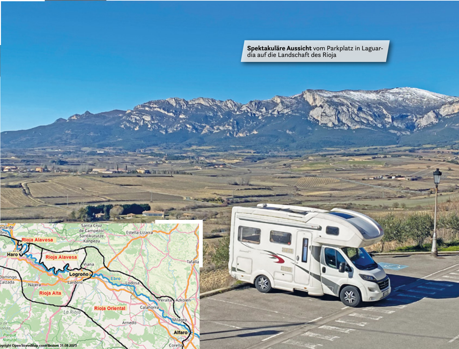
Spektakuläre Aussicht vom Parkplatz in Laguardia auf die Landschaft des Rioja

Die meisten der berühmten Bodegas sind sehr gut mit dem Wohnmobil erreichbar und es gibt auch recht gute Parkmöglichkeiten. Allerdings sind diese gerade in der Hauptsaison von Juni bis Oktober stark frequentiert und einige können nur nach einer Reservierungsbestätigung besichtigt werden. Daher lohnt es sich auf jeden Fall, sich schon vor der Reise mit solchen Bodegas zu beschäftigen, um dann frühzeitig eine