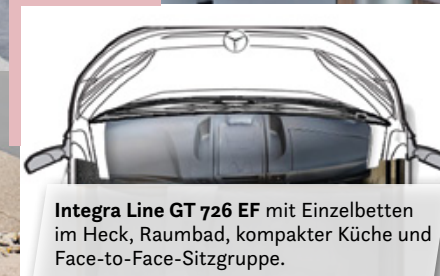
Integra Line GT 726 EF mit Einzelbetten im Heck, Raumbad, kompakter Küche und Face-to-Face-Sitzgruppe.