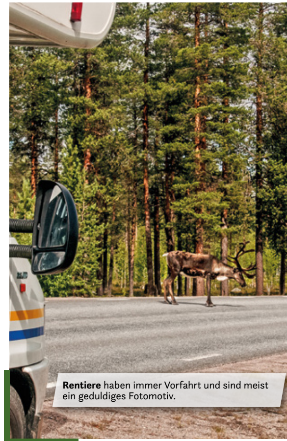
Rentiere haben immer Vorfahrt und sind meist ein geduldiges Fotomotiv.

Hier erleben wir die pure wilde Schönheit Lapplands hautnah! Der Abisko Nationalpark verzaubert uns mit unberührter