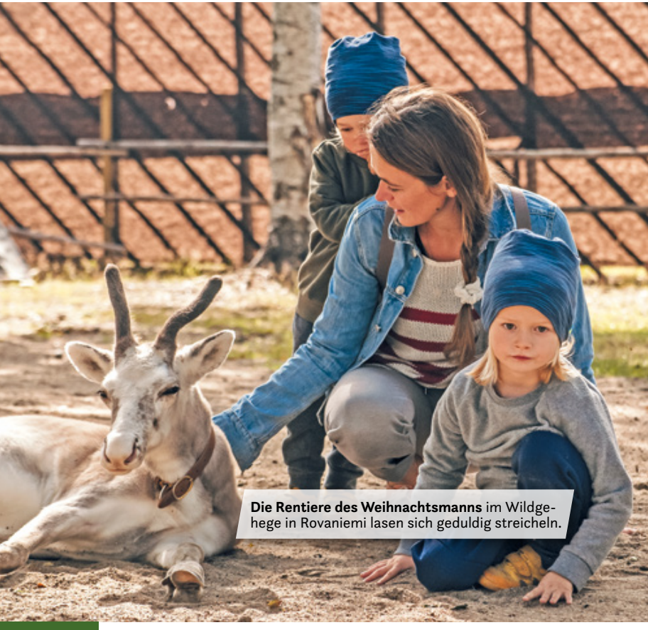
Die Rentiere des Weihnachtsmanns im Wildgehege in Rovaniemi lassen sich geduldig streicheln.

Für uns war die Rundreise hoch in den Norden Europas mit unserem Euramobil-Wohnmobil hier zu Ende und wir treten die rund 2500 Kilometer lange Heimreise an.