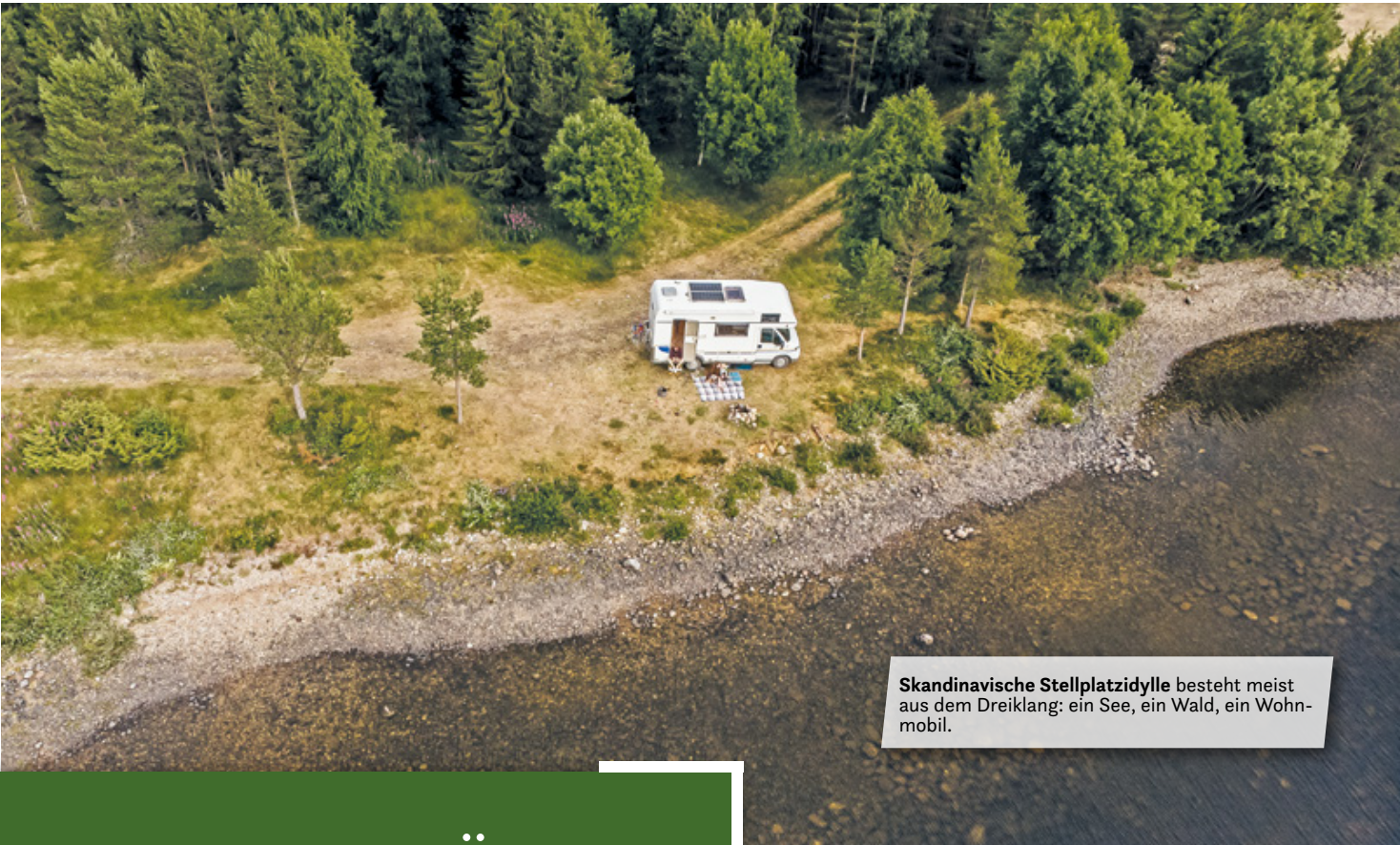
Skandinavische Stellplatzidylle besteht meist aus dem Dreiklang: ein See, ein Wald, ein Wohnmobil.