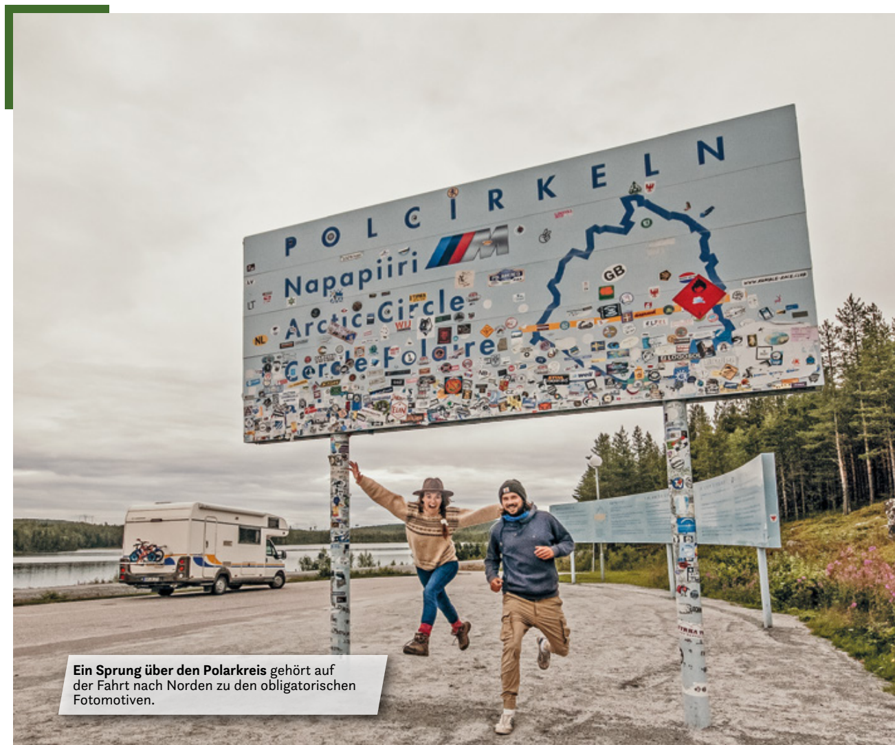
Ein Sprung über den Polarkreis gehört auf der Fahrt nach Norden zu den obligatorischen Fotomotiven.

Mit unserem Wohnmobil waren wir zwölf Tage unterwegs und haben jeden einzelnen Moment genossen. Die Inselgruppe ist einfach magisch.