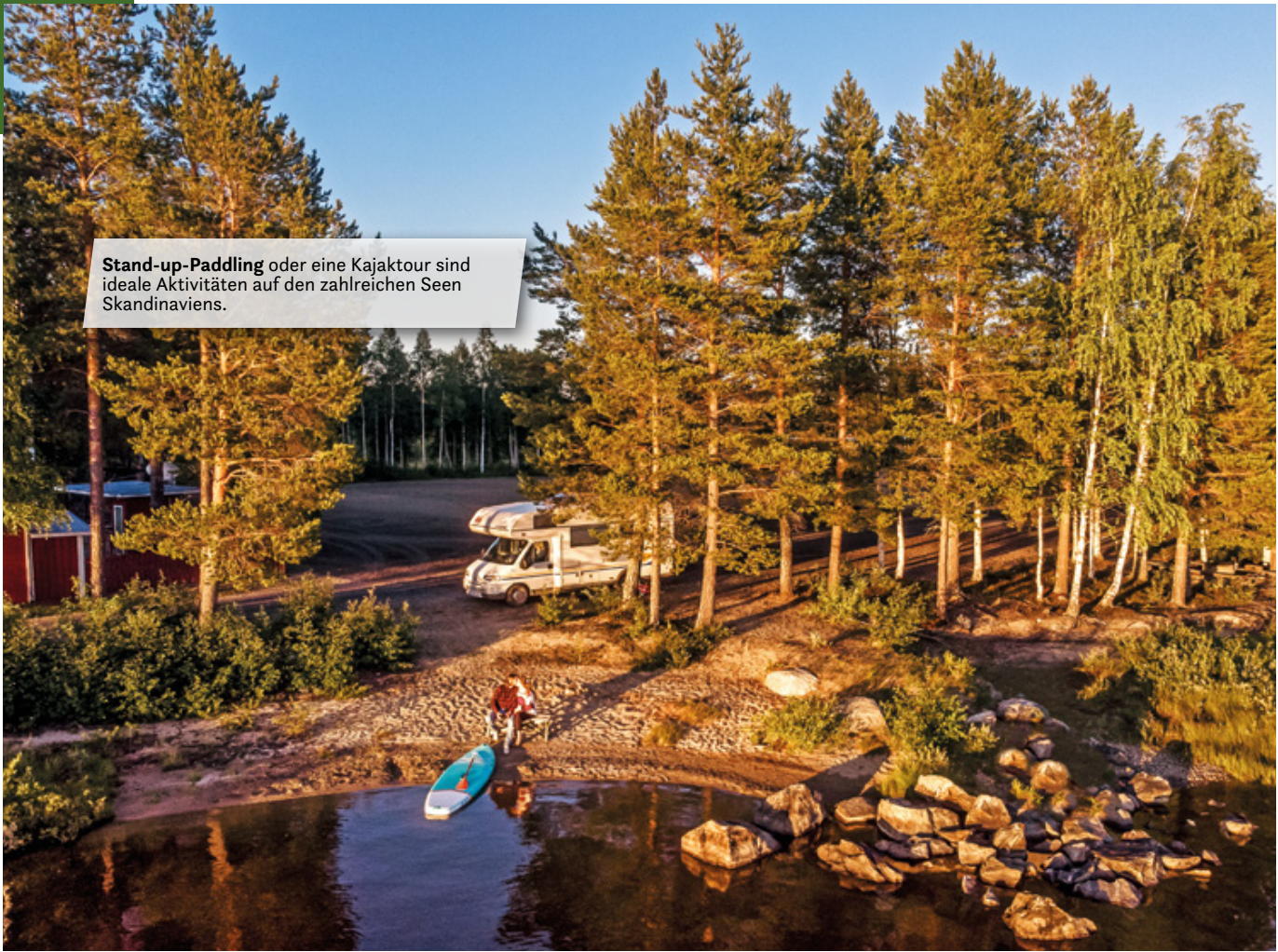
Stand-up-Paddling oder eine Kajaktour sind ideale Aktivitäten auf den zahlreichen Seen Skandinaviens.

von hier aus über die Grenze Richtung Süden führt. Vor allem nahe der finnischen Grenze eine wirklich schöne Strecke mit tollen Landschaftlichen Eindrücken. Unser Ziel ist das Santa Claus Village in „Rovaniemi“.