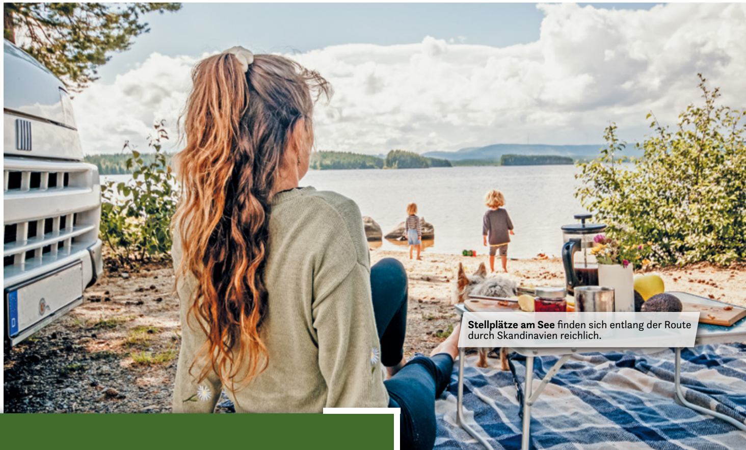
Stellplätze am See finden sich entlang der Route durch Skandinavien reichlich.