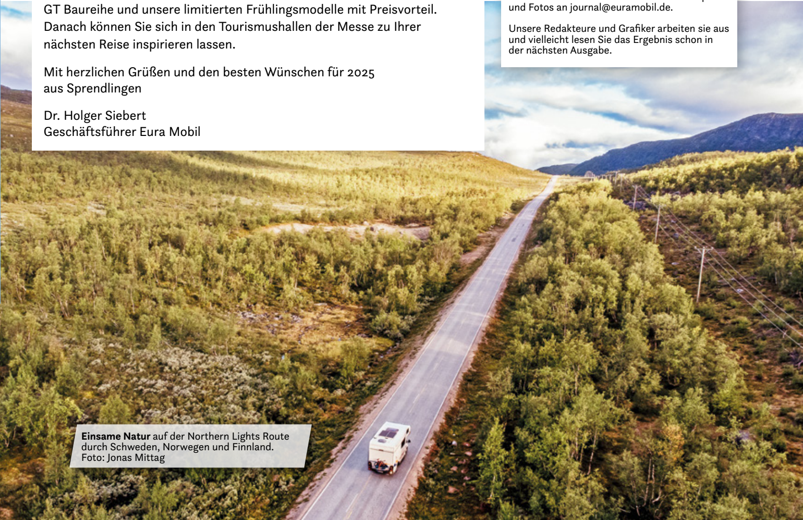
Einsame Natur auf der Northern Lights Route durch Schweden, Norwegen und Finnland.

Unsere Redakteure und Grafiker arbeiten sie aus und vielleicht lesen Sie das Ergebnis schon in der nächsten Ausgabe.