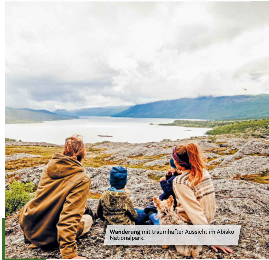
Wanderung mit traumhafter Aussicht im Abisko Nationalpark.

Natur, kristallklaren Flüssen und majestätischen Bergen. Ein echtes Paradies für Wanderer und Naturfotografen. Wagemutige Abenteurer gehen hier den sagenumwobenen „Kungsleden“, einen etwa 450 km langen Wanderweg für erfahrene Hiker mit guten Survival-Fähigkeiten. Mit zwei kleinen Kindern und zu wenig Erfahrung belassen wir es bei einigen Halbtagestouren in dieser wirklich atemberaubenden Landschaft. Schon die Anfahrt von Kiruna aus ins Nationalparkgebiet ist eine echtes Highlight; je näher wir dem Park kamen, desto spektakulärer wurde die Landschaft. An der Touristeninformation des Abisko Nationalparks gibt es auch ein „Naturum“, was in Schweden so etwas wie ein kostenloses Naturkundemuseum ist. Diese gibt es in jedem Nationalpark und ein Besuch lohnt sich eigentlich immer. Hier erfährt man alles zur Tier- und Pflanzenwelt des Parks und erhält alle nützlichen Infos zu den möglichen Wanderwegen und Übernachtungsmöglichkeiten. Der Abisko Nationalpark war wirklich ein außergewöhnliches Erlebnis, das wir weiterempfehlen können.