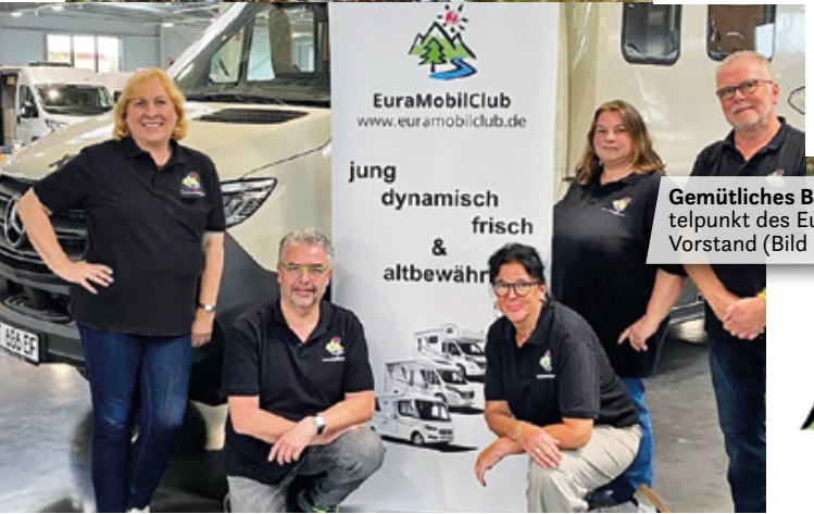
Gemütliches Beisammensein steht im Mittelpunkt des Eura Mobil Clubs und liegt dem Vorstand (Bild links) sehr am Herzen.