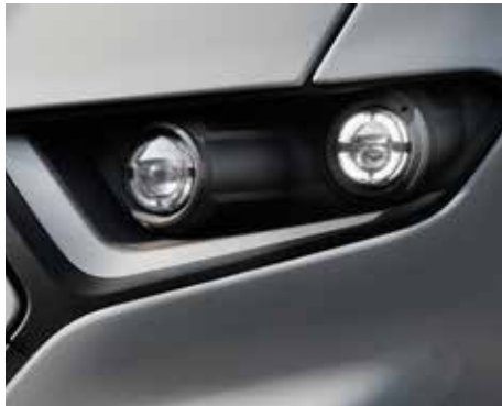
LED-Hochleistungsscheinwerfer erhellen die Nacht.