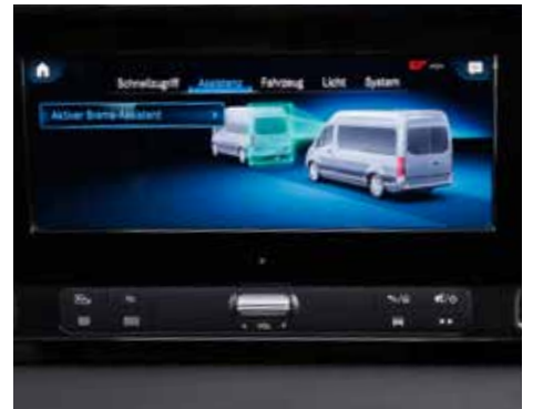
Moderne Assistenz- und Sicherheitssysteme für mehr Komfort und Sicherheit.