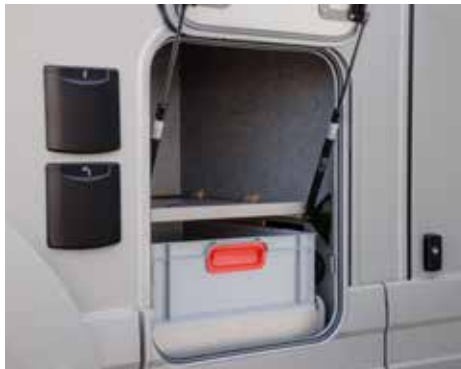
Nach oben öffnende Liner-Klappen für bequemes Be- und Entladen.