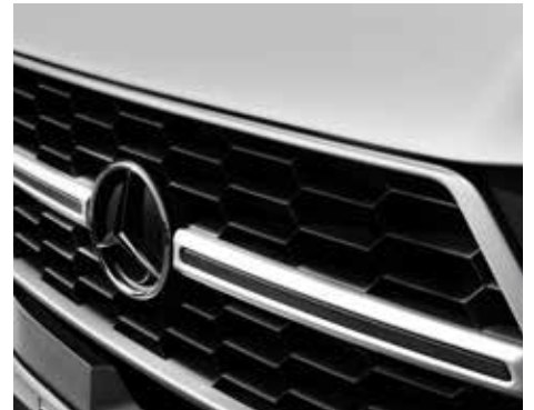
Kühlergrill mit edler Metallic-Einrahmung.