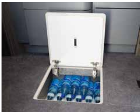
Bodenluken ermöglichen auch von innen den Zugriff auf den Stauraum im Doppelboden.