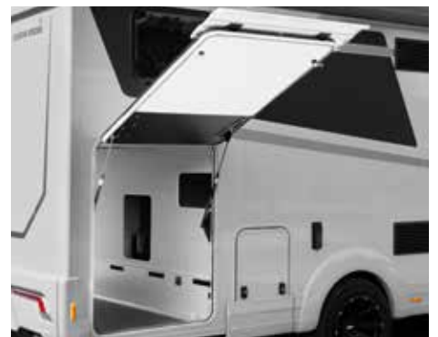
Besonders großes Ladevolumen durch Doppelbodenhöhe von 30 cm.