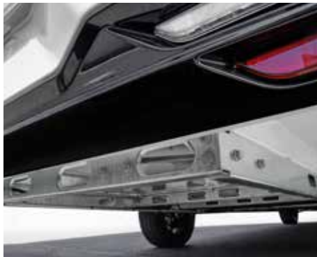
Extra tiefer Spezialrahmen für sicheres Fahrverhalten und maximales Ladevolumen.