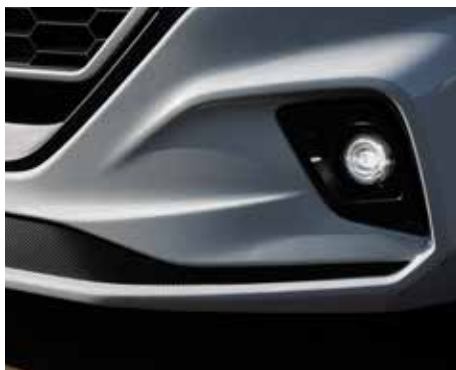
High End RIM Front mit dynamischen Hervorhebungen von Leuchenträgern und Lufteinlässen.