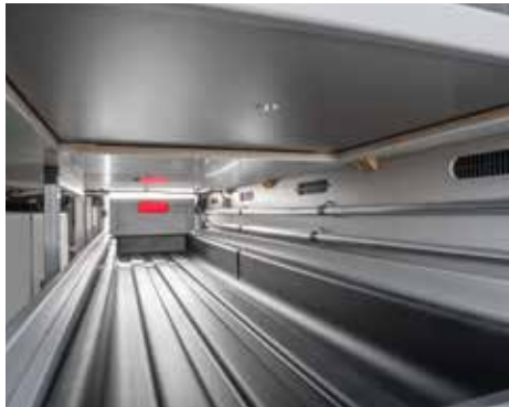
Stauwanne von beiden Seiten und von innen zugänglich. Zum Beladen der integrierten Euro-Boxen bzw. der feuchtigkeitsgeschützten Bodenwanne.