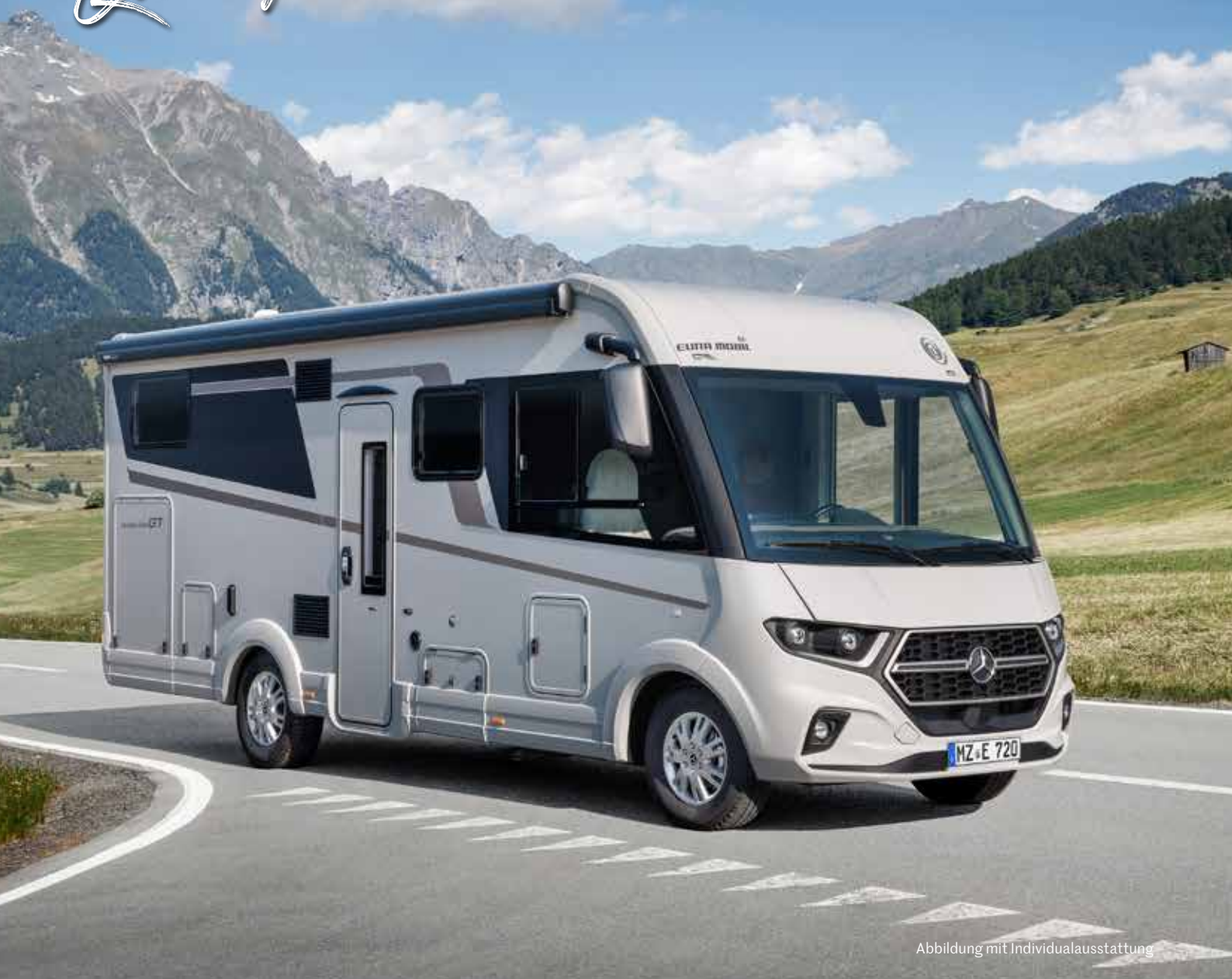
Abbildung mit Individualausstattung