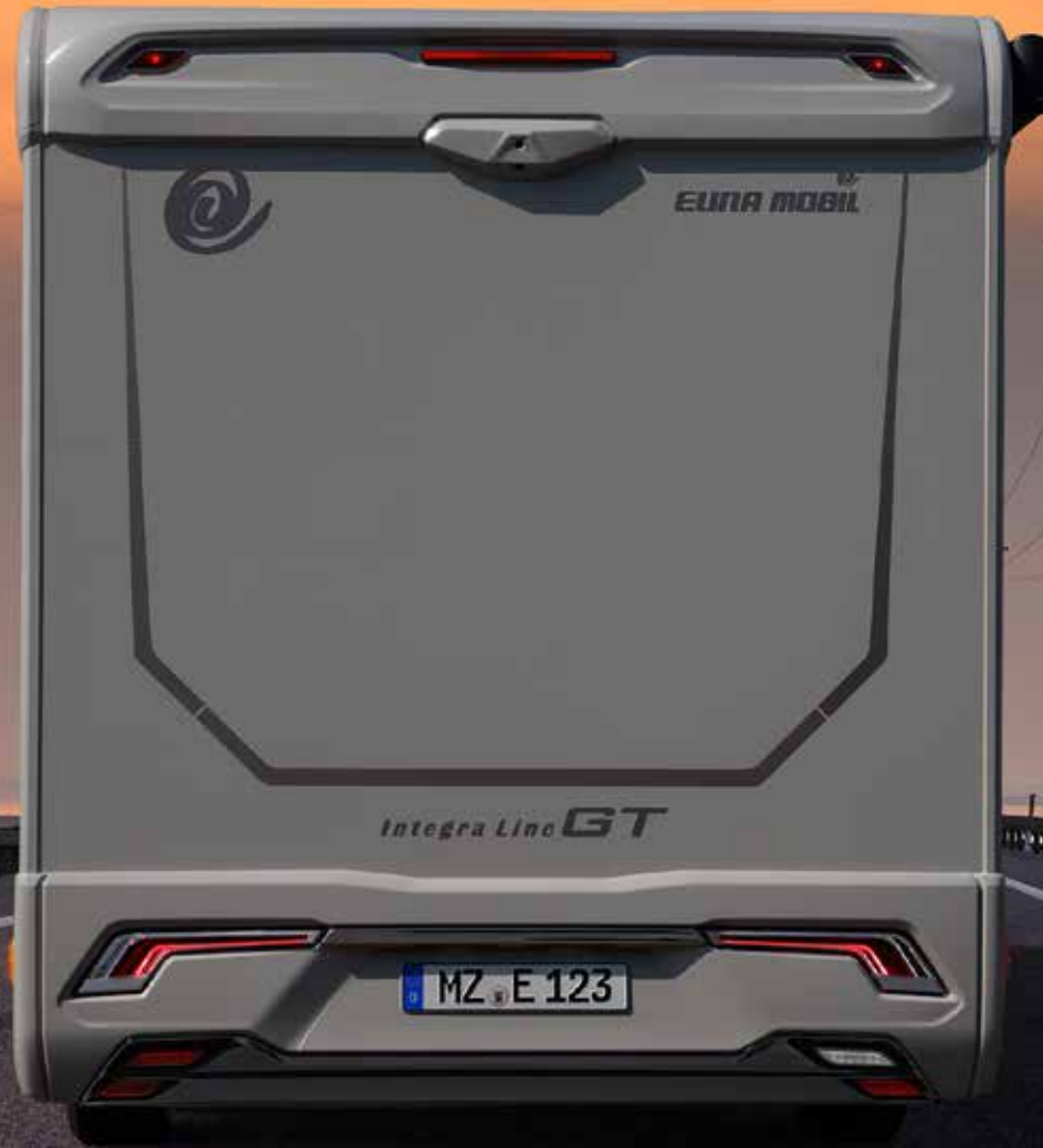
Abbildung mit Individualausstattung

Alle Angaben in dieser Broschüre beziehen sich auf die hier aufgeführten Produkte und gelten nicht für andere Produkte der Eura Mobil GmbH. Die in dieser Broschüre abgebildeten Modelle zeigen die Ausstattung für Deutschland. Sie enthalten zum Teil auch Sonderausstattungen und Zubehör, die nicht zum serienmäßigen Lieferumfang gehören. In verschiedenen Ländern sind aufgrund gesetzlicher Bestimmungen Abweichungen von den hier beschriebenen Modellvarianten und Ausstattungen möglich. Bitte informieren Sie sich über den genauen Umfang und das lieferbare Programm der modellspezifischen sowie der modellunabhängigen Ausstattung bei Ihrem Eura Mobil Händler. Irrtümer und Änderungen von Konstruktion, Ausstattung und Sonderausstattung vorbehalten. Wir arbeiten ständig an der Verbesserung der Qualität unserer Fahrzeuge, weshalb wir uns vorbehalten, auch im laufenden Modelljahr Veränderungen bei der Ausstattung/Sonderausstattung vorzunehmen. Die neueste aktuelle Ausstattung, Sonderausstattung und Paketinhalte finden Sie daher ausschließlich im Online Konfigurator auf www.euramobil.de . Bei Ein- und Umbauten sind Aufbauperstellvorgaben, Herstellervorgaben, sowie die gesetzlichen Vorgaben der StVZO und der StVo zu beachten, bzw. einzuhalten. Mit Erscheinen dieser Broschüre verlieren alle vorherigen Kataloge ihre Gültigkeit.