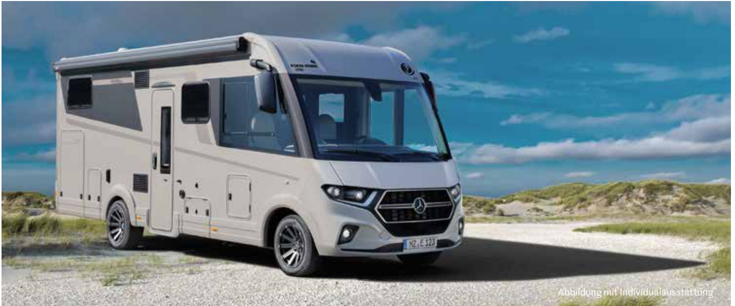
Abbildung mit Individualausstattung

Angaben zu den Gewichten der ab Werk für unsere Wohnmobile und Vans angebotenen Pakete und Sonderausstattungen finden Sie in unserem Konfigurator und in den technischen Daten.