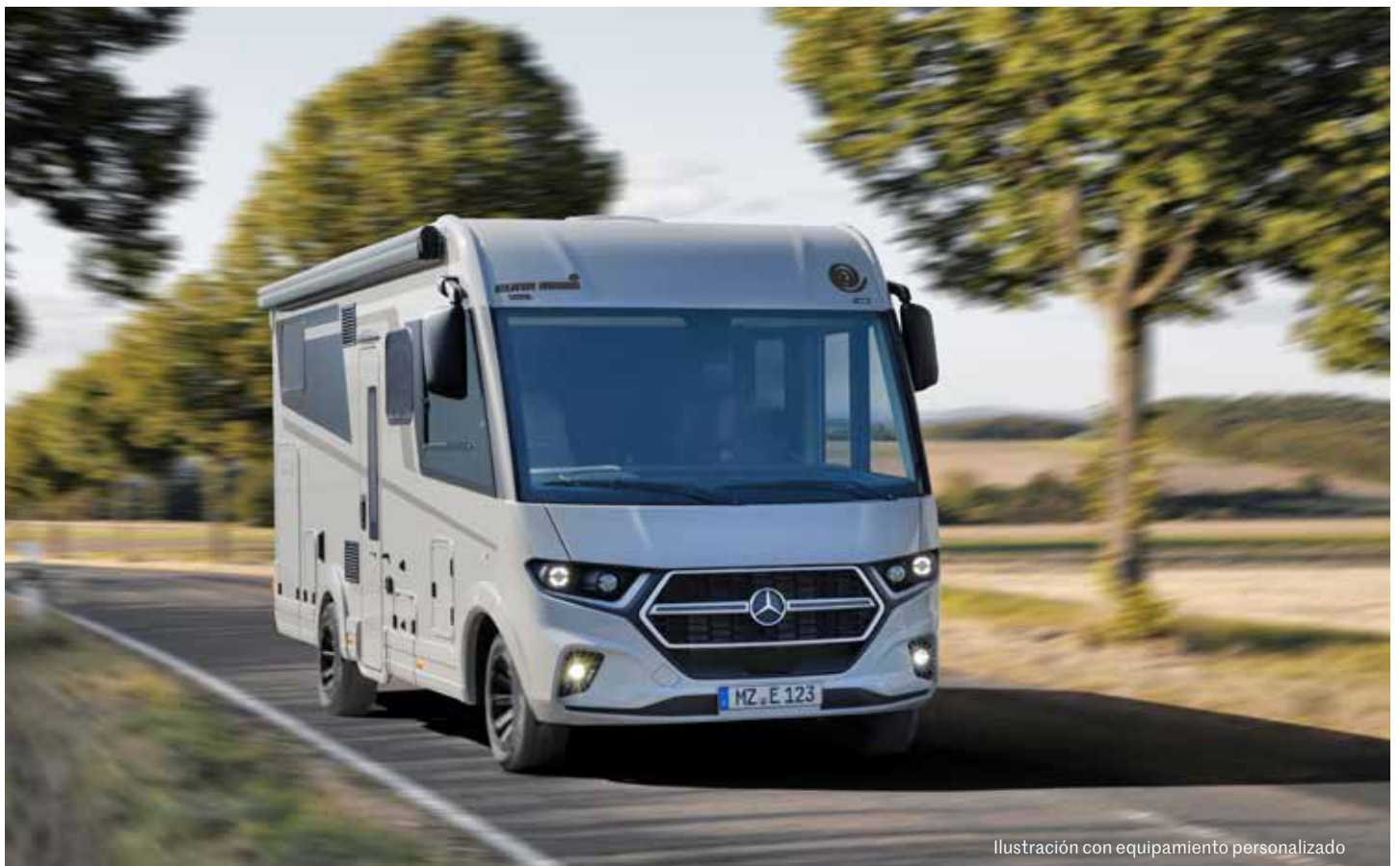
Ilustración con equipamiento personalizado