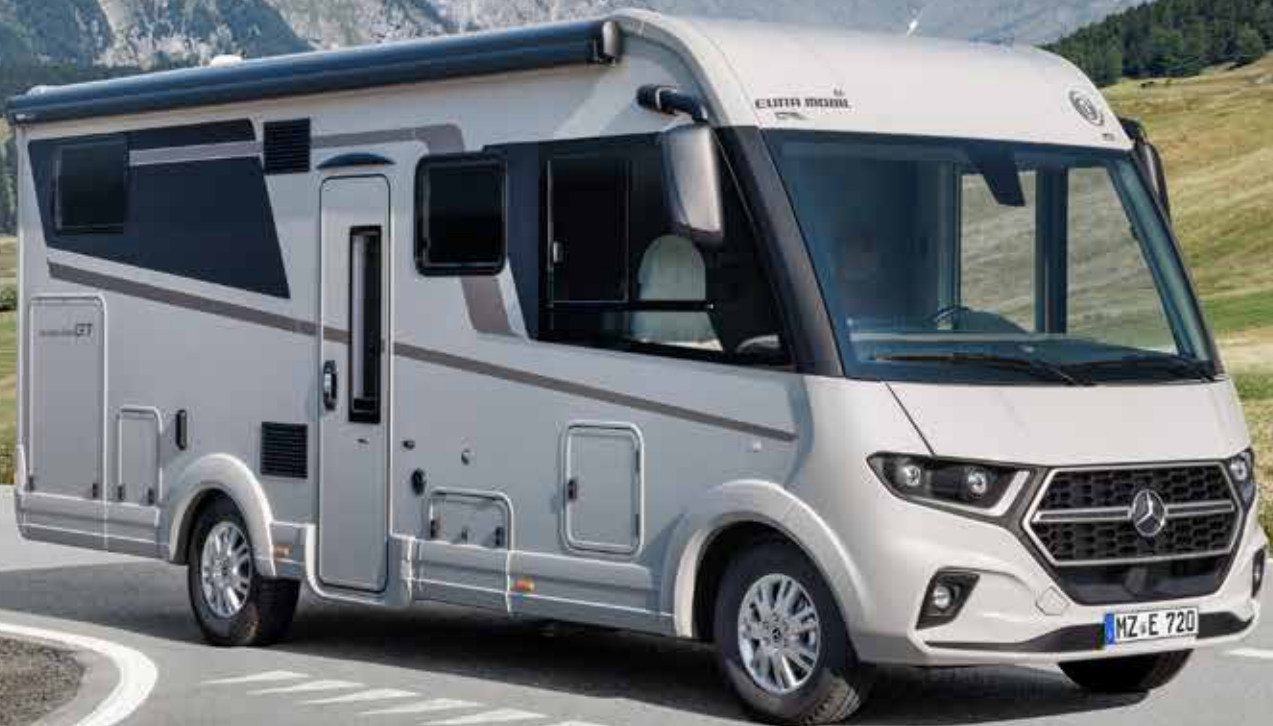
Ilustración con equipamiento personalizado